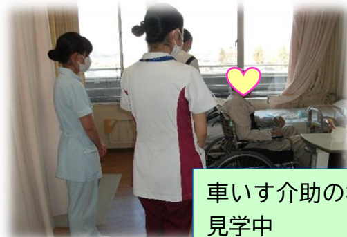
車いす介助の様子を見学中