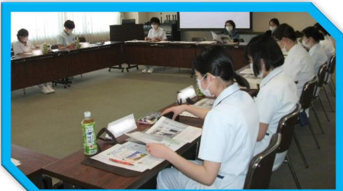
看護部長から病院の概要についての説明

今年度3回目となるインターンシップを3月22日(金)に行いました。今回は13名の看護学生さんの参加がありました。