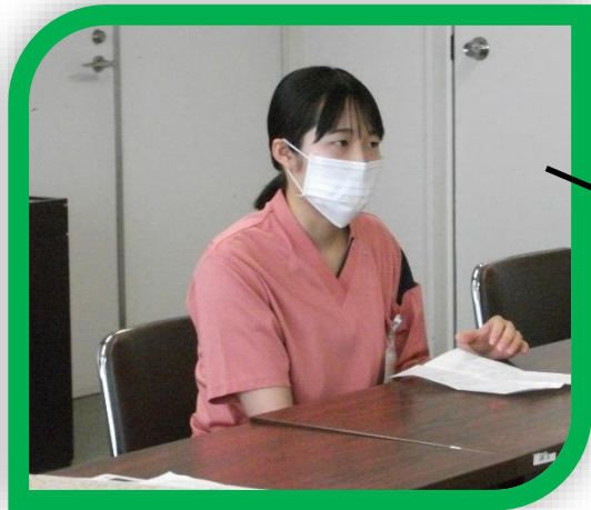
2年目看護師から、当院を選んだ理由や勤務の様子、新人教育についての説明がありました。また看護学生さんから多くの質問もありました。