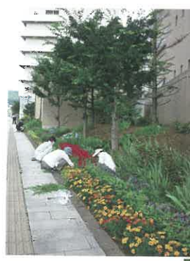
植栽ボランティア

また、7月には、地域づくり未来塾でエントランスホールに大笹を使い、七夕飾りをしていただきました。天井につくほどの立派な七夕飾りで、来院者、職員も季節を感じられる1週間となりました。病院では、その他にもボランティア活動がありますが、感染防止のため、活動ができていないものもあります。いつかボランティアのみなさんの活動が制限なくできるようにと、七夕に願いを込めて。