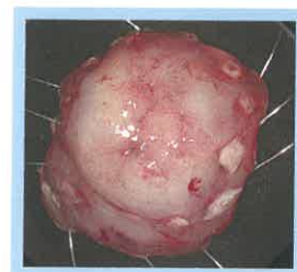
図2：図1の病変を内視鏡治療で切除した早期胃がんの肉眼所見(大きき15 mm)