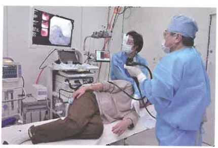
須高地区における対策型胃内視鏡検診3年間の結果

市町村が中心になって行う対策型胃検診（集団検診）は、従来バリウムを用いたX線検査で行われてきました。2017年に制度が改訂され、検診方法が「内視鏡による検診」と「X線による検診」を各個人が選択できるようにになりました。内視鏡検診のメリットは表1のように、がんの発見率が高いこと（X線検診の7.8倍）、X線では写らないような初期がんが発見でき、おなかを切らずに内視鏡治療（図1、図2）で治癒する割合が高いこと（60%以上）、胃がんだけでなく食道がんも発見できることなどが挙げられます。「内視鏡は苦しいので苦手」という方がいますが、鎮静薬を使って眠った状態で安楽に検査を行うことが可能です。また、当院では人間ドック（個別検診）でも内視鏡を中心とした胃検診を行っています。さらに、大腸がんや大腸ポリーフが気になる方は、便潜血検査だけでなくオプシジョンとして内視鏡による大腸検診（大腸ドック）を受けることができます。胃腸の検診は、効率のよい内視鏡検診をお薦めします。