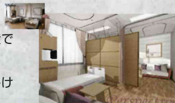
(4人部屋から2人部屋の改修イメージ)

リニューアル時期は12月を予定しております。工事期間中は利用者の皆様にはご迷惑をお掛けいたしますが、何卒ご理解を賜りますようお願い申し上げます。