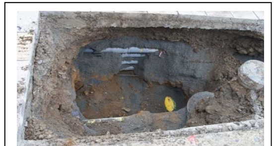
病院北側国道の歩道を試掘しました

前回お知らせしましたとおり、新棟建設に伴い、水道使用量の増加が見込まれることから、院内への水道引込管取り替えが必要となります。その取り替えに先立ち、病院北側国道の歩道を試掘しました。歩道の下には、水道管、電気の埋設管、ガス管などいろいろな管がありました。