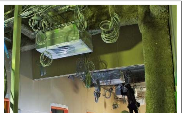
空調機器の取り付けも行われました